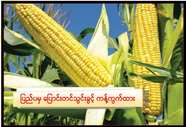
ပြည်ပမှ ပြောင်းတင်သွင်းခွင့် ကန့်ကွက်ထား