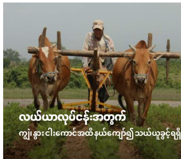
လယ်ယာလုပ်ငန်းအတွက် ကျွဲ၊ နွားငါးကောင်အထိ နယ်ကျော်၍ သယ်ယူခွင့်ရရှိ